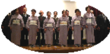
大翔岳風会亥の子谷支部

11月8日に第4回「いのこだに芸術祭」が開催されました。日本伝統芸能の詩吟・雅楽・チェロとピアノによる演奏・女性コーラスの懐かしい歌・お母ちゃんパワーで会場をおおいに沸かせた劇「うらしま太郎」が上演されました。文化水準の高〜い、とっても充実した一日でした。創作室では陶芸体験教室、ロビーでは絵画と陶芸の展示がありました。このような豊かな文化に触れることのできる施設が、身近にあるのは素晴らしいことです。