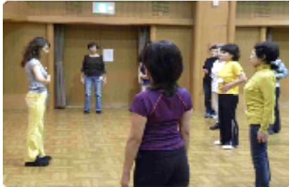
美しく歩く為の準備はOK!

10月7日～11月11日(全3回講座) お腹を引き上げる事によって、腹筋が鍛えられ内臓が正しい位置に収まり、腹圧が強くなります。便秘も軽減されます!