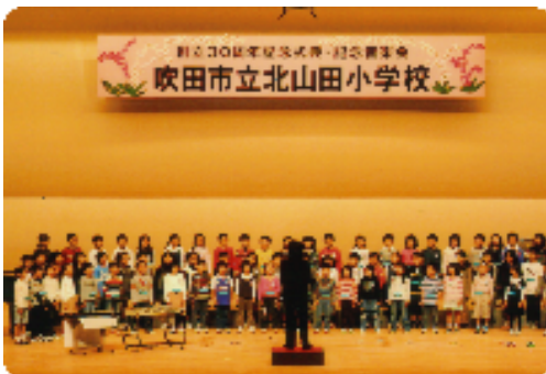
子ども達の素晴らしい歌声

11月6日、北山田小学校は創立三十周年を迎えメシアターで、式典・1～6年生による音楽会・プロの方による演奏会が行われました。子ども達の合唱・合奏は、みんな自信に満ち溢れ素晴らしいものでした。地域の方々にも、普段みることのできない子ども達の発表を見ていただき、とても喜んでいただけました。また、祝賀会も阪急エキスポパークホテルで盛大に開催いたしました。170名もの皆様にご出席くださいました。学校・地域そして保護者が一体となって素晴らしい三十周年を迎えることができ、喜ばしく思っています。これからも、北山田小学校が、ますます発展していくことを願っています。