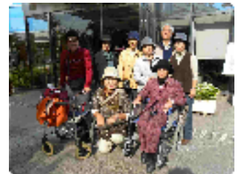
車椅子に乗っての町歩き

恒例の町歩き点検も回を重ねることにより、改善された箇所も多くなったと感心しつつ、今回は山田南方面に足を伸ばしました。当日はお天気にも恵まれ参加者は8人でした。それぞれ4人ずつA・Bコースにわかれ、亥の子谷コミュニティセンターを出発しました。車椅子に乗っての点検は、さまざまな点に気づかされたひとときでした。