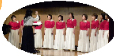
カリヨンコーラス