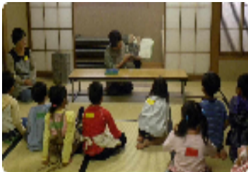
「3びきのくま」の絵本