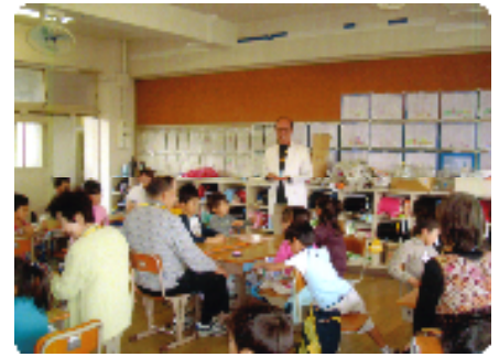
高齢者の話に聴き入る子ども達

当日は、地区の高齢者20数名が、各クラスに分かれて子ども達と給食を一緒にいただきました。皆さん方は、自分の孫と食事をしているようでした。なお、当日の献立は魚の煮付（骨がないよう）、肉じゃが、吸い物、ご飯、牛乳。私達の時代とはぜんぜん違う感じでした。食事の後は子どもたちとスゴロクなどのゲームをし、短い時間でしたが楽しく過ごすことができました。