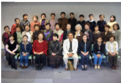
受講生全員集合です