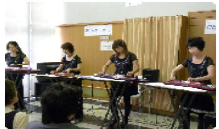
大正琴の調べがロビーに響きました

10月25日(日) 第120回 TUBASA(翼)によるロビーコンサートが開催されました。演歌からポップスまで幅広い演奏を楽しみました。