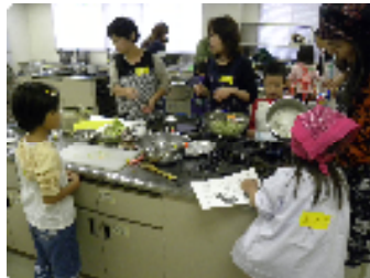
親子でキャベツのクッキング

毎回好評の企画です。今回の料理は、お話「3びきのくま」に出てくるキャベツのスープとホットケーキミックスで作るクレープでした。子どもたちが初めて包丁を使い野菜を切り、ホットプレートでクレープを焼きました。親は、ケガやヤケドをしないかとハラハラドキドキしながら手伝っていましたが、無事に美味しくできてみんな大満足でした。